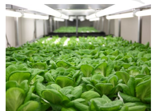
< 植物栽培施設 >