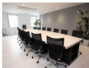
< 会議室 >