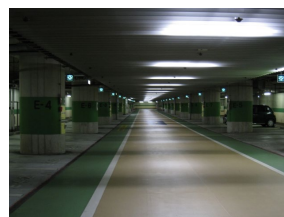
< 地下駐車場 >